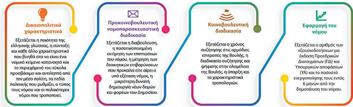
Σχήμα 1: Η δομή του Δείκτη Ποιότητας Νομοθέτησης

Συνολικά, οι μεταβλητές που περιλαμβάνονται στις 4 ανωτέρω κατηγορίες είναι 67 από τις οποίες αξιολογούνται οι 50. Οι υπόλοιπες 17 συλλέγουν κατηγορικά δεδομένα για τους νόμους και δεν αξιολογούνται αλλά βοηθούν στην ταξινόμηση και επεξεργασία των υπόλοιπων δεδομένων 26 .